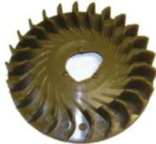
Lüfterrad DM 200