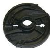
Führung Sperrklinke DM 200