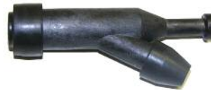
Zündkerzenstecker DM 200