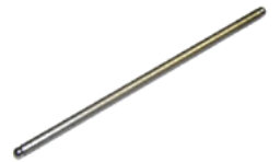
Stößelstange DM 200