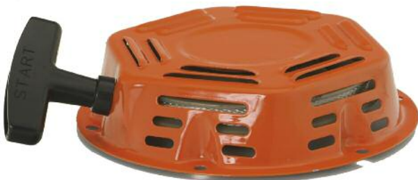
Rücklaufanlasser kpl. DM 200