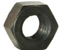
Zapfen , Einstellmutter DM 200