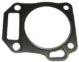
Dichtung Zylinderkopf DM 200