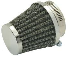
Sport Luftfilter 35mm für DM