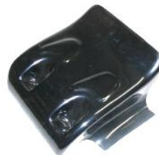
Motorabdeckung DM 200