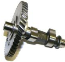
Nockenwelle DM 200