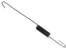
Drehzahlregler Feder DM 200