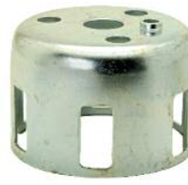
Schwungrad DM 160