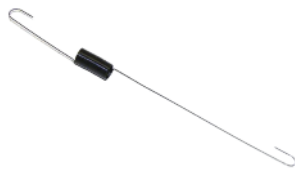
Rückholdrosselfeder DM 200