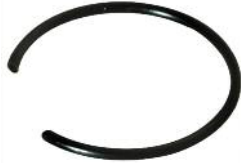
Kolbenbolzen Sicherungsring DM 200