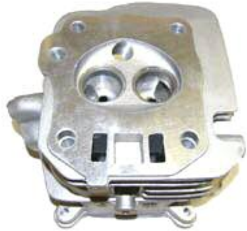
Zylinderkopf DM 200