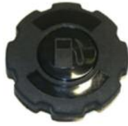
Tankdeckel mit Dichtung DM