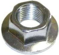
Spezialmutter 14 mm für Kurbelwelle DM 200