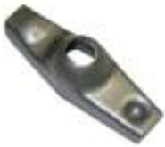
Kipphebel DM 200