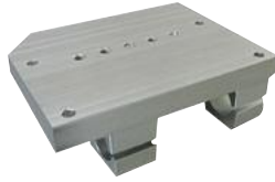
Motor Schiebebock für 200er Motoren