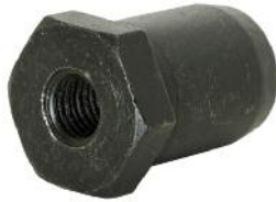
Kipphebel Zapfen DM 200