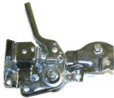
Reglermechanik komplett DM