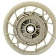
Haspel für Rücklaufanlasser DM 200