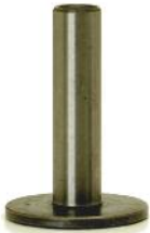
Ventilheber DM 200