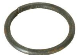
Federsicherung DM 200