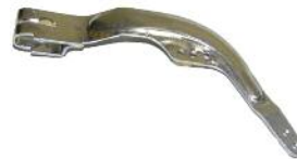
Drehzahlreglerarm DM 200