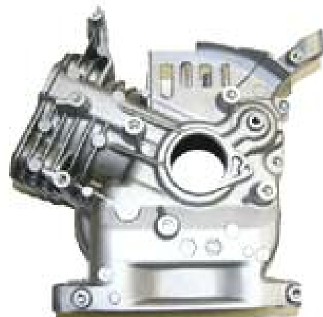
Motorgehäuse DM 200