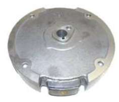
Schwungrad DM 200