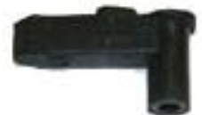
Sperrklinke DM 200