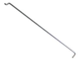
Reglerstange DM 200