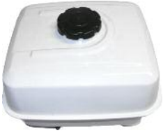
Tank weiß GX 200