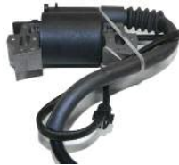
Zündspule komplett DM 200