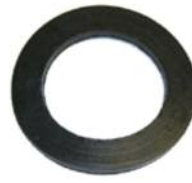
Tankdeckeldichtung DM 200