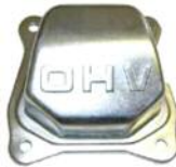
Zylinderkopf Deckel DM 200