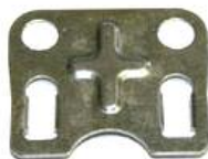
Führungsplatte Schubstange DM 200