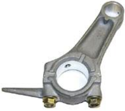
Pleuel DM 200