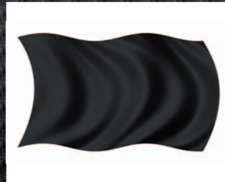
0503406 Fahne schwarz

Überholverbot! Achtung Gefahr! Zwei geschwenkte Flaggen: Große Gefahr, die Strecke ist womöglich ganz oder teilweise blockiert. Bereit sein, anzuhalten!