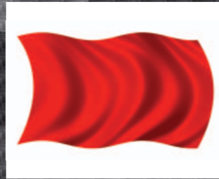
0503404 Fahne rot

Signalisiert einem Fahrer, der überrundet wird, dass sich ein schnelleres Fahrzeug nähert, dem das Vorbeifahren zu ermöglichen ist. Geschwenkt: Ein schnelleres Fahrzeug setzt zum Überholen an. Es ist sofort vorbei zu lassen. Wenn die blauen Flaggen dreimal missachtet werden, wird eine Durchfahrtsstrafe (Drive-Through-Penalty) verhängt.