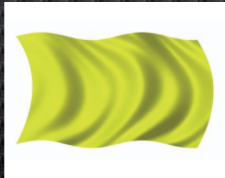
0503405 Fahne gelb

Abbruch des Trainings oder Rennens. Weitere Einzelheiten sind in der Ausschreibung geregelt.